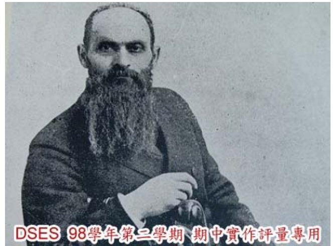
DSES 98學年第二學期 期中實作評量專用

◆馬偕是比許多台灣人更愛台灣的人，事實上，馬偕對於台灣並不僅止於「愛」，做為北台灣第一位基督教傳教士，他與台灣近代史中的宗教、醫療、教育都有著密不可分的关系。一八七二年來到台灣的馬偕，在淡水紮根，選擇了當時猶是基督教處女地的北台灣作為宣教的地域。當時民間由於不瞭解而對基督教懷有強烈敵意，再加上外在環境如衛生和交通條件的不便，使得馬偕在台灣初期的宣教工作備極艱辛，但是馬偕卻抱著「寧願燒盡，不願毀朽」的態度推動教務，到一八八〇他第一次返回加拿大述職之前，他已經在北台灣建立了二十所教會，為基督教在北台灣的拓展打下堅實的根基。